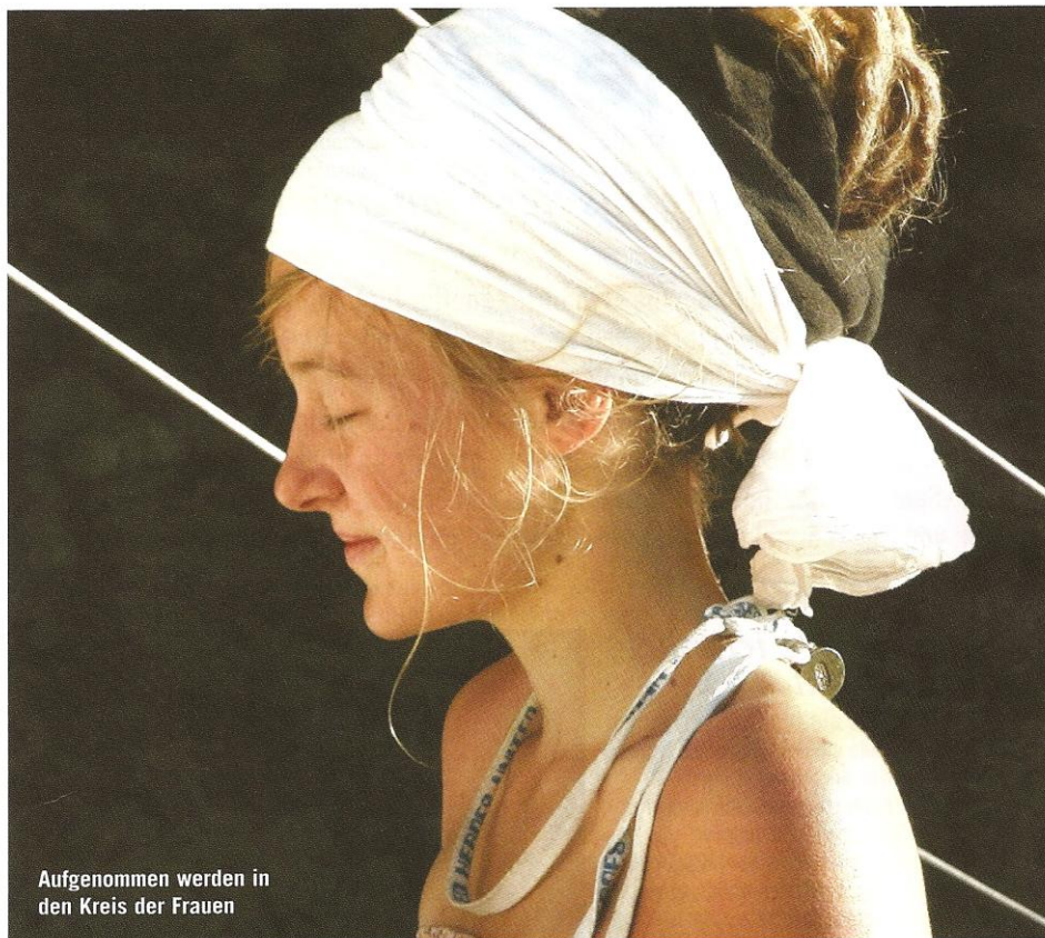
Aufgenommen werden in den Kreis der Frauen

wartet, ob ich sie noch zu Gesicht bekomme. Sie kam nicht, deshalb habe ich mich schließlich doch auf den Weg gemacht. Plötzlich hatte ich wieder Kraft und flog praktisch den Berg hinunter, so leicht und frei habe ich mich gefühlt. Unten im Dorf habe ich als erstes meine Schwester gesehen. Wir sollten ja noch nicht sprechen, so haben wir uns nur angelächelt, und sie hat mir den schmalen Weg frei gemacht. Im Tipi waren schon